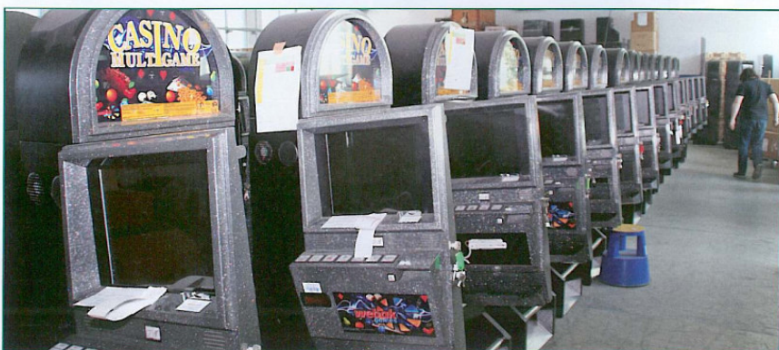
Endmontage und Qualitätskontrolle am Firmensitz der Webak im österreichischen Gmunden.

Optisch auffallend bei dieser Neuentwicklung ist die flache Bauweise. Das Gerät ist mit einem 19 Zoll gro-